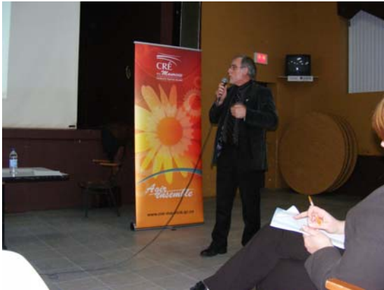
Séance de consultation tenue à La Tuque le 12 mars 2008